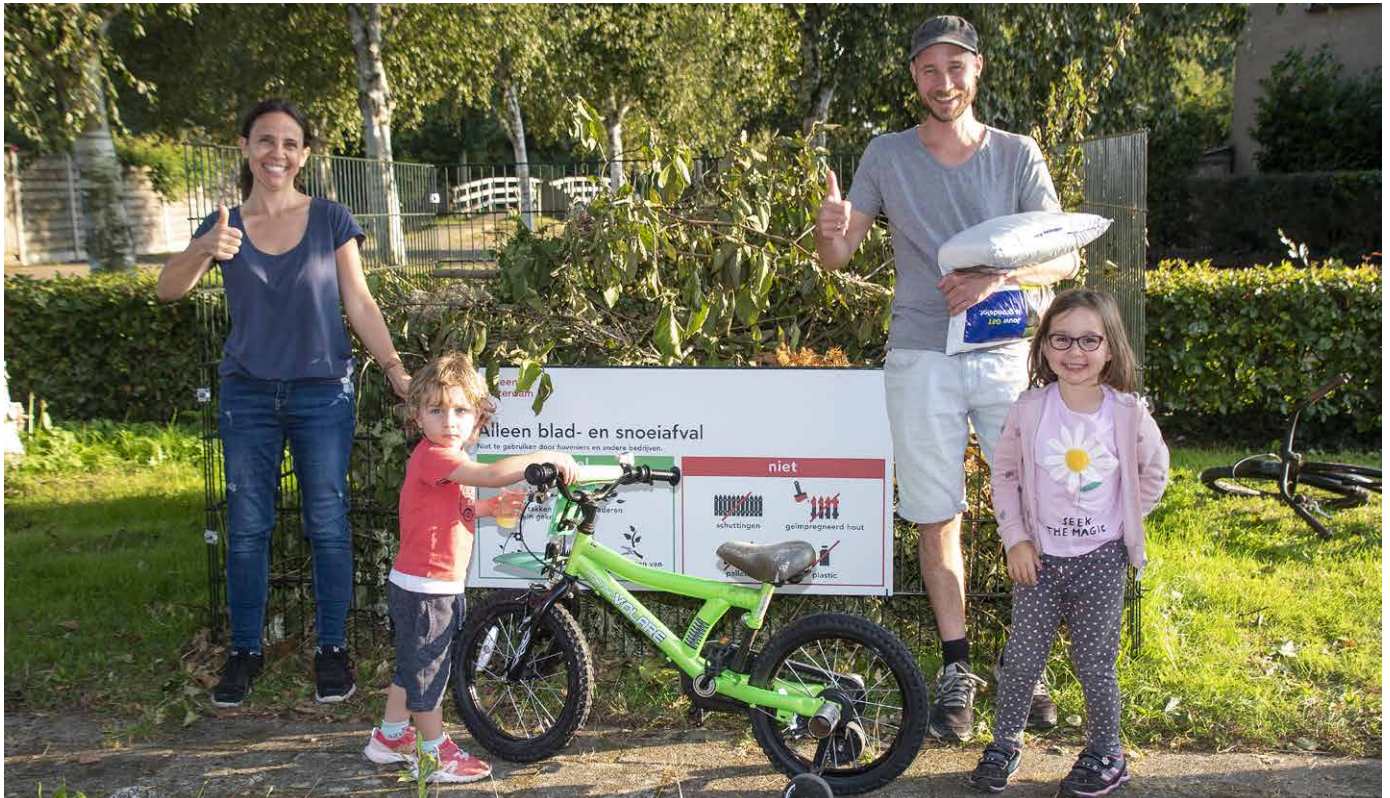
Gezin bij tuinkorf met compost

Nu de lente is begonnen, zijn veel mensen weer aan het tuinieren. Tussen april en juli dit jaar plaatsen we daarom ruim 100 tuinkorven op proef, verdeeld over de stad. Dat doen we in buurten met veel tuinen. Per tuinkorf kijken we hoe deze wordt gebruikt en of die aan het einde van het snoeiseizoen kan blijven staan. Een week voordat we de tuinkorven plaatsen, krijgen bewoners hierover een brief en een flyer.