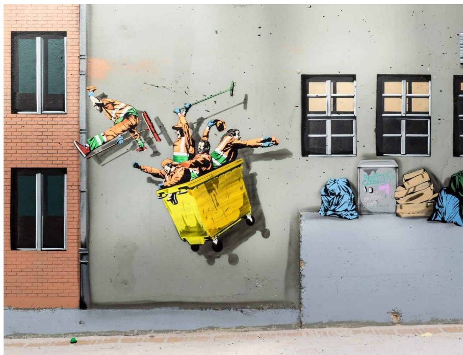
Jaune met zijn kunstwerken