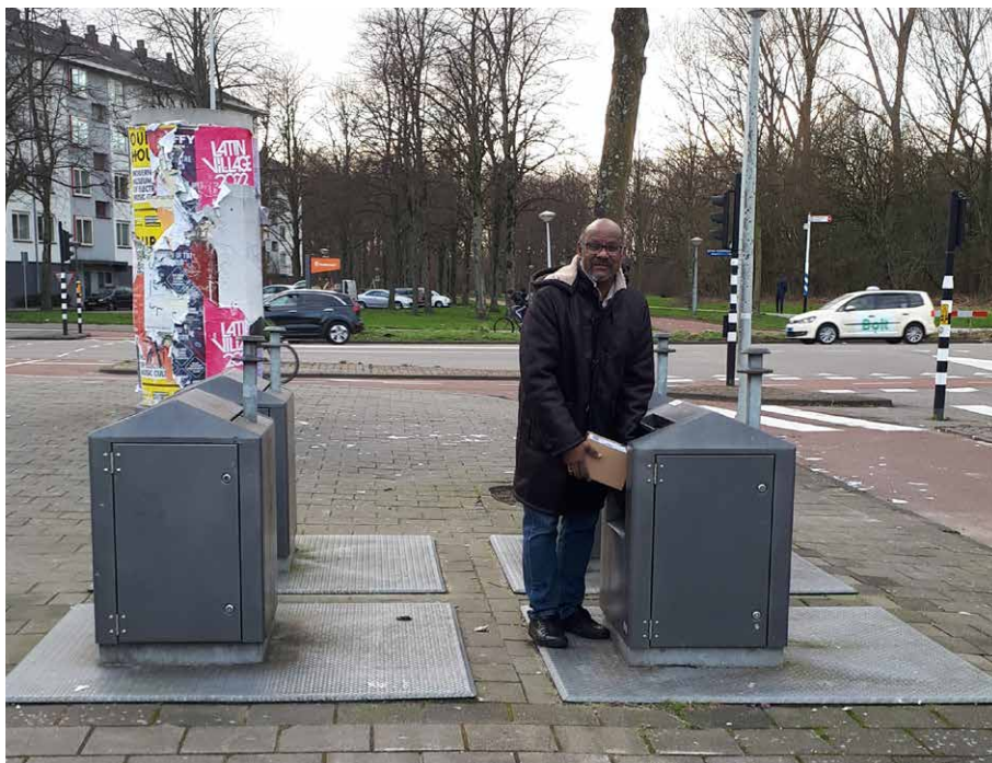
Op de hoek Robert Fruinlaan en Johan Huizingalaan