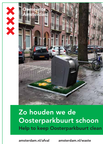
Voorbeeld van een folder

Nieuw is dat u ook een poster aan kunt vragen met daarop de dag en de tijd waarop grof afval buiten mag worden gezet. Bijvoorbeeld om in het portiek te hangen als u een gezamenlijke voordeur heeft. Of achter uw raam. U kunt de poster bestellen in A4- of A3-formaat . Het is niet de bedoeling dat u de poster op een container plakt. Onze vuilnismannen moeten 'm er dan weer vanaf halen.