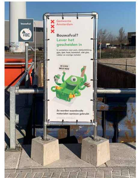
Het bord dat bij de container voor bouwafval staat

Amsterdam heeft zes Afvalpunten. Op een Afvalpunt kunnen bewoners van Amsterdam alle soorten afval gratis inleveren, behalve restafval. Denk aan karton, matrassen, tuinafval, klein chemisch afval en spullen voor de kringloop.