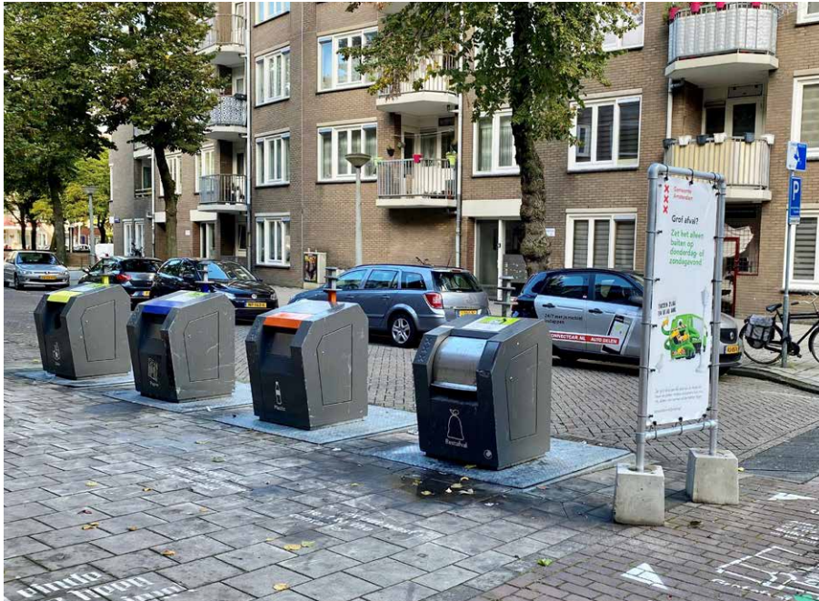
De campagne voor grof afval

Amsterdam is een stad om trots op te zijn. En een stad die we graag netjes houden met en voor elkaar. Samen met u zet de gemeente zich hiervoor in. Het gaat alleen nog niet altijd goed. Naast sommige containers staat nog te vaak afval. Daarom startten we in februari vanuit Aanpak bijplaatsingen een campagne.