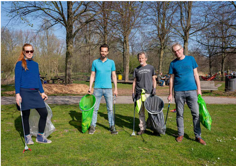
Een paar mensen van het Vuilnisoproer in actie bij het (op)Ruim Rondje Sloterplas.

Kijk voor meer informatie op vuilnisoproer.nl .