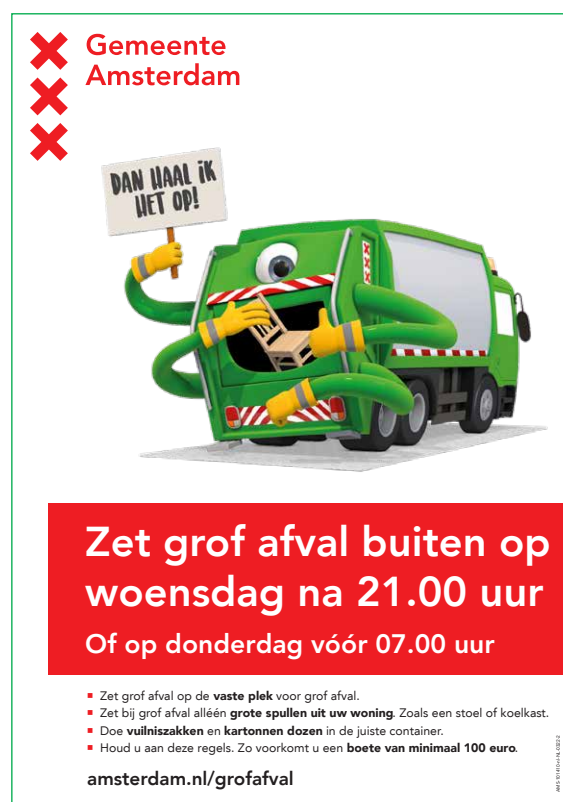
Voorbeeld van een poster

Hieronder nog even in het kort wat u aan kunt vragen: