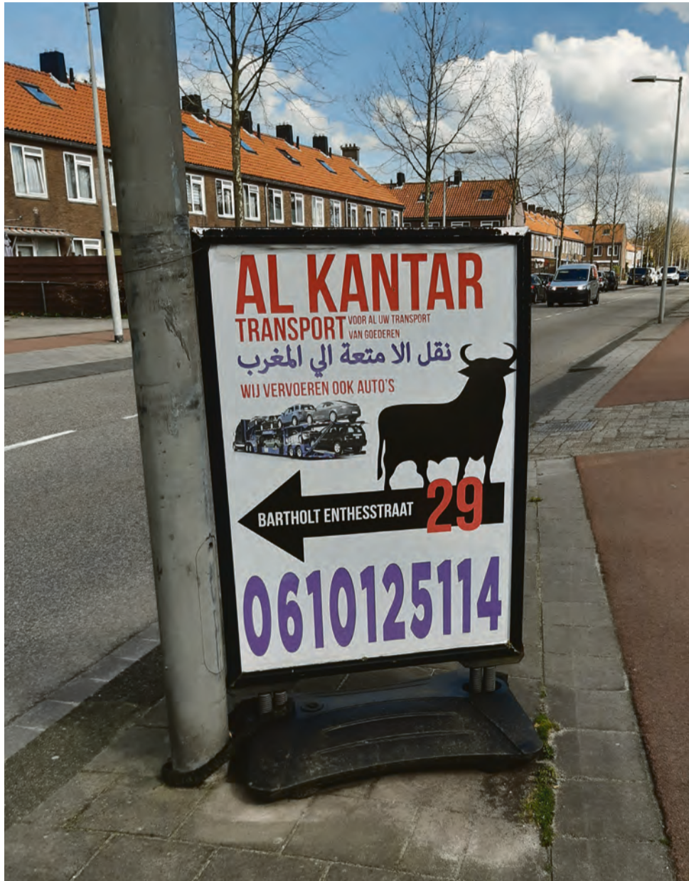
Reclamebord in de Savornin Lohmanstraat.

Al-Kantar bestaat sinds 2007 en inmiddels is er veel concurrentie. Menigeen regelt zelf