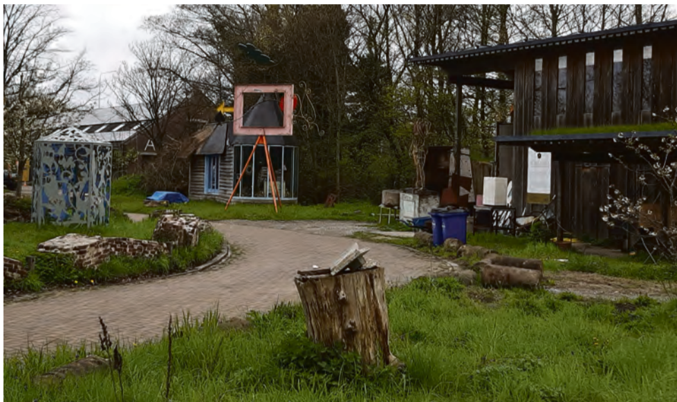
Paradijselijk terrein van De 1800 Roeden.

In een wat afgelegen hoek van onze mooie polder ligt nog een geheim verstopt: DE 1800 ROEDEN. Tot 1984 was het complex in gebruik als munitieopslagplaats, gebouwd tussen 1870 en 1910, op 1800 roeden (1 roede is 3,767 meter) afstand van de Haarlemmer Poort, toen de westelijke grens van Amsterdam. Je vindt het helemaal aan het einde van de Joris van de Berghweg, tegen de Haarlemmerweg aan.