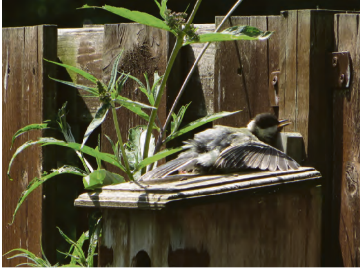
Koolmeesje in hete zomerzon.