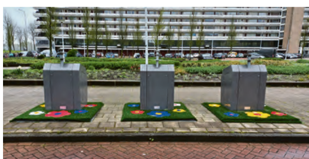
Lodewijk van Deysselstraat (boven) en Burgemeester Hogguerstraat.

* Het zg 'Tegelwippen' is weer begonnen! In de maanden april t/m juni + september en oktober haalt de Tegelservice van de gemeente de gewipte tegels uit uw tuin op (gratis, vanaf de hoek van de straat), die u dan voor groen kunt vervangen. Dit alles om de stad aan de klimaatverandering aan te passen. Voor meer informatie: https://www.amsterdam.nl/nieuws/nieuwsoverzicht/tegelwippen/