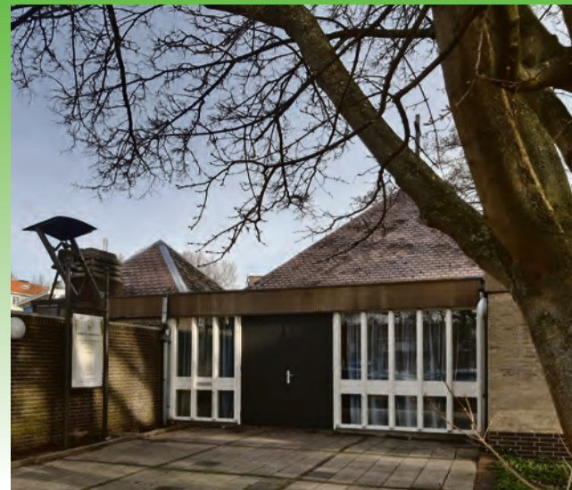
'Gunung Batu', Molukse kerk.

Na de dienst is er weer tijd voor ontmoeting, met koffie. Gisteravond vierde men hier dat 'Gunung Batu' (vaste rots) 30 jaar geleden dit gebouw in gebruik nam. Daarvoor was het de kerk van de Nieuw Apostolische Gemeente. 'Gunung Batu' huurde sinds de stichting in de tachtiger jaren in andere kerken ruimten voor de samenkomsten. Er zijn nog heel wat broodjes en quiches over. Ik krijg er ook wat van mee.