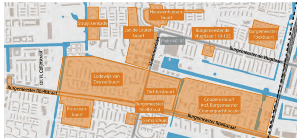
Boven: De Struijckenkade nu. Midden: De Struijckenkade hoe het wordt. Onder: Totaaloverzicht van bouwlocaties in Slotermeer.