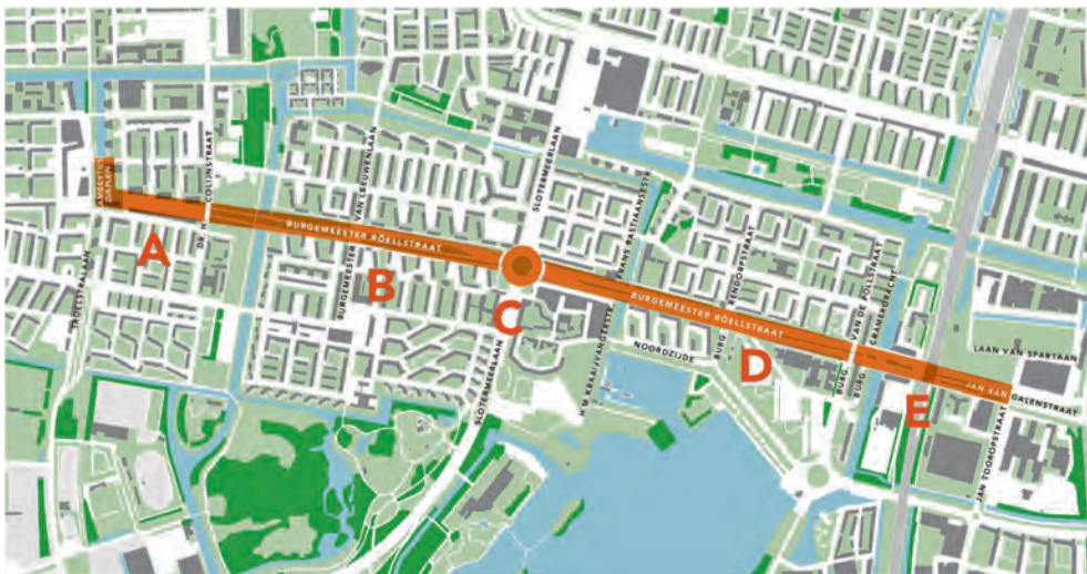
Werkzaamheden aan de Röellstraat, van Geuzenveld tot het OLVG West. Afbeelding: Gemeente Amsterdam

Omdat de Röellstraat open ligt van de Colijnstraat tot en met de ring A10, wordt het extra druk op de z.g. buurtring, waardoor in de Colijnstraat en op de Ruysch de Beerenbrouckstraat, bij de afslag van en naar de Haarlemmerweg ook altijd opstoppingen ontstaan. Als je dan besluit om te gaan lopen of fietsen, tref je het ook niet. Soms houdt een fietspad ineens op en rijdt je tegen een hek bij een bouwplaats en bij de brug in de Lodewijk van Deijsselstraat. Zelfs lopend kun je daar niet langs, waardoor mensen die niet zo ver kunnen lopen of met een rollator hun weg zoeken, honderden meters moeten omlopen. Hetzelfde gebeurt in buurten waar woningen worden gesloopt en gerenoveerd. Ook daar kun je, van de ene op andere dag, je dagelijkse route niet meer vervolgen. Het zal allemaal wel nodig zijn om het onderhoud te kunnen doen en uiteindelijk weer een mooie wijk te realiseren. Maar het mag wel op wat minder plekken tegelijk, en met name voor voetgangers en fietsers, wat beter aangegeven worden. Tot die tijd hebben we gelukkig nog wat te klagen, onze favoriete Amsterdamse hobby tenslotte.