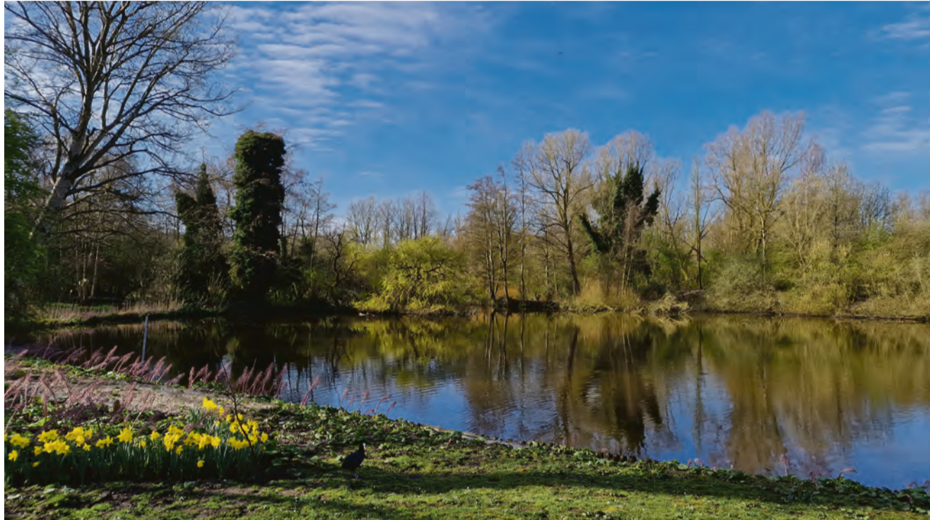
Prachtige buurt natuur (de waterplas tussen Heemtuin en Ruige Riet Sloterpark).

Tijdens een wandeling door het park komt het ook voor. Vaak zijn mensen in hun hoofd zo druk bezig met alle gedoe in hun leven, of zo druk met een ander in gesprek, dat de meest mooie, leuke, bizarre natuurmomenten gemist worden.