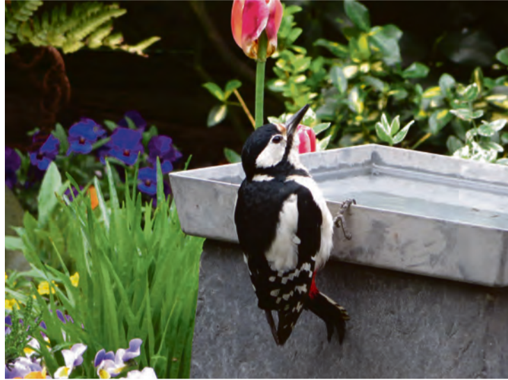
Grote bonte specht komt slokje halen.

verpesten, want... altijd zon? Ik moet er niet aan denken! Sowieso zou ik de vier seizoenen niet willen missen, want wat is het fascinerend, om al die transformaties in de natuur te kunnen zien én door je lijf te voelen. Ook vind ik het gewoon een verademing, om aan het einde van een bepaald seizoen te kunnen verlangen naar het volgende, omdat je het huidige inmiddels helemaal zat bent.