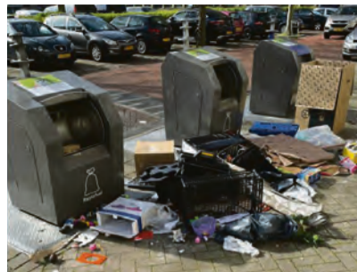
Voor en na

'Mensen met elkaar verbinden en achterhalen wat bewoners beweegt' is een belangrijke taak van de opbouwwerkers bij Eigenwijks. Om dit goed te doen zoeken wij steeds naar nieuwe vormen. Om u een beetje inzicht te geven van waar opbouwwerkers mee bezig zijn, interview ik mijn collega's uit Geuzenveld en Sloterveer. Deze keer wil ik u meenemen in wat ik zelf zoal doe binnen het mooie Geuzenveld.