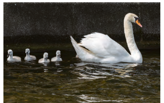
Boven: Vaarexcursie Sloterpark; ook een gezellig samenzijn. Foto: Wouter Dolmans. Onder: Varen over de Sloterplas. Foto: Paul Koene

Geregeld zal ik als gids op de boot aanwezig zijn en worden tijdens het varen een aantal speciale plekken en natuurmomenten onder de aandacht gebracht. Denk aan de Sloterplaspelikaan, de lepelaars die er eens gebroed hebben of de roodwangschildpad die eieren legde. Tevens komen ook de quaggamossel, de ijsvogel en misschien zelfs het monster van de Sloterplas voorbij.