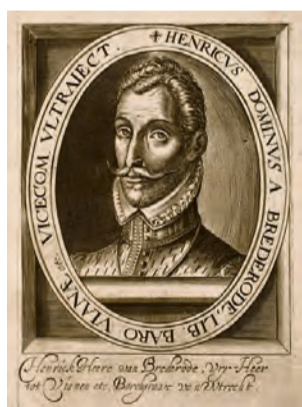
Hendrik van Brederode, De Grote Geus.

Geuzenveld is genoemd naar de (Water)geuzen. De Geuzen waren actief betrokken bij de opstand van Willem van Oranje en de andere edelen uit de Lage Landen, tegen de Spaanse overheersing en het gebrek aan (godsdienst)vrijheid. Veel van onze straten dragen de naam van een van deze Geuzen. Sommigen weten wie de naamgever van hun straat is, maar voor velen is het niet meer dan een vreemde naam op een straatnaambordje. De komende kranten zullen we proberen om de bekendheid van de Geuzen (straatnamen) wat te vergroten.